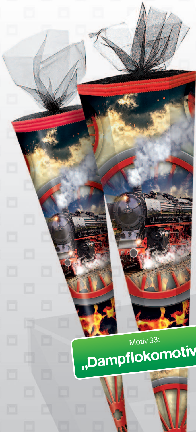
Motiv 33: „Dampflokomotive“