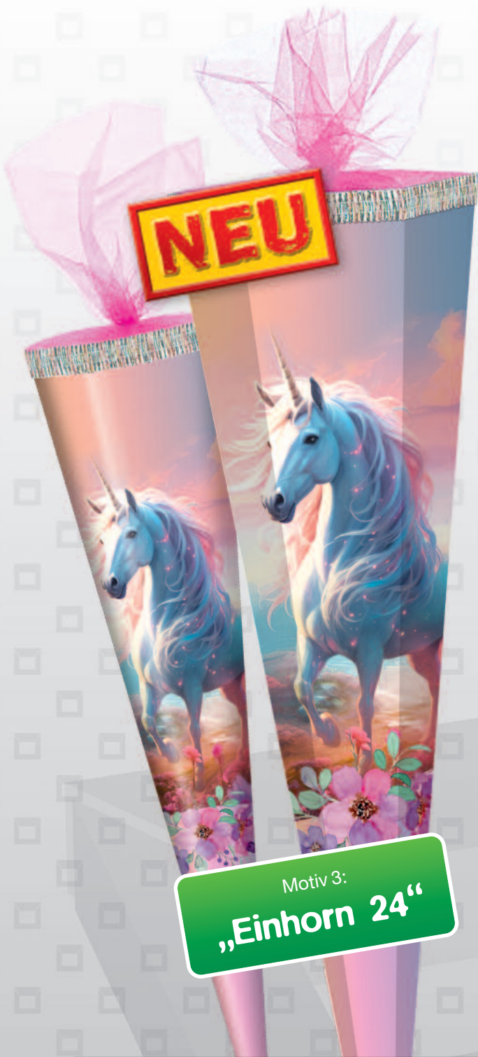
Motiv 3: „Einhorn 24“