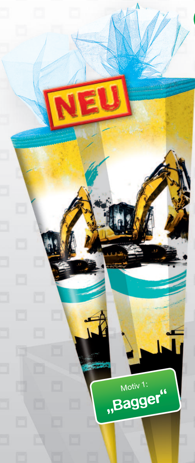
Motiv 1: „Bagger“