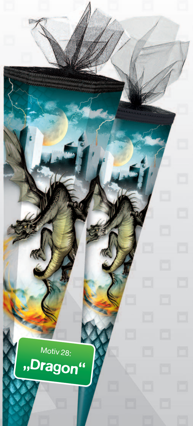
Motiv 28: „Dragon“