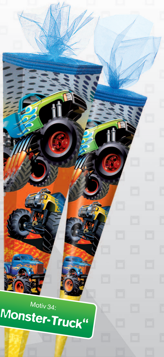
Motiv 34: „Monster-Truck“