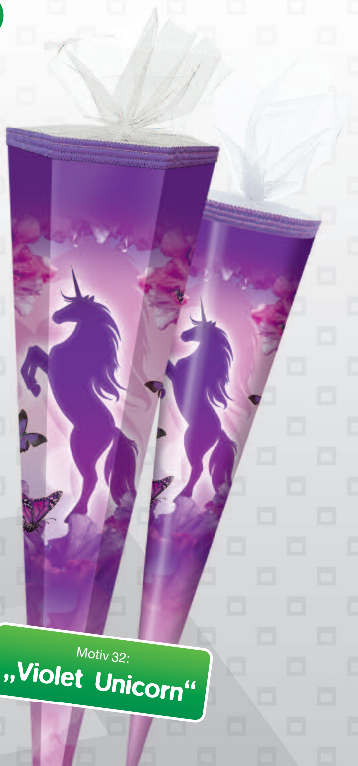
Motiv 32: „Violet Unicorn“