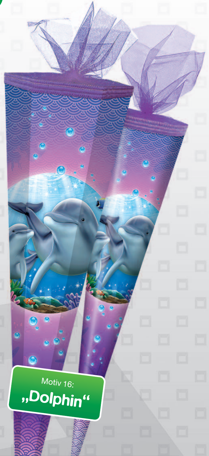
Motiv 16: „Dolphin“