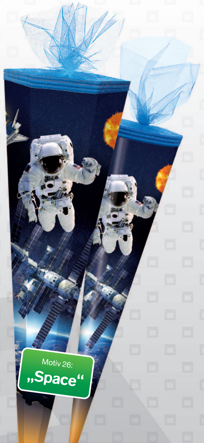
Motiv 26: „Space“