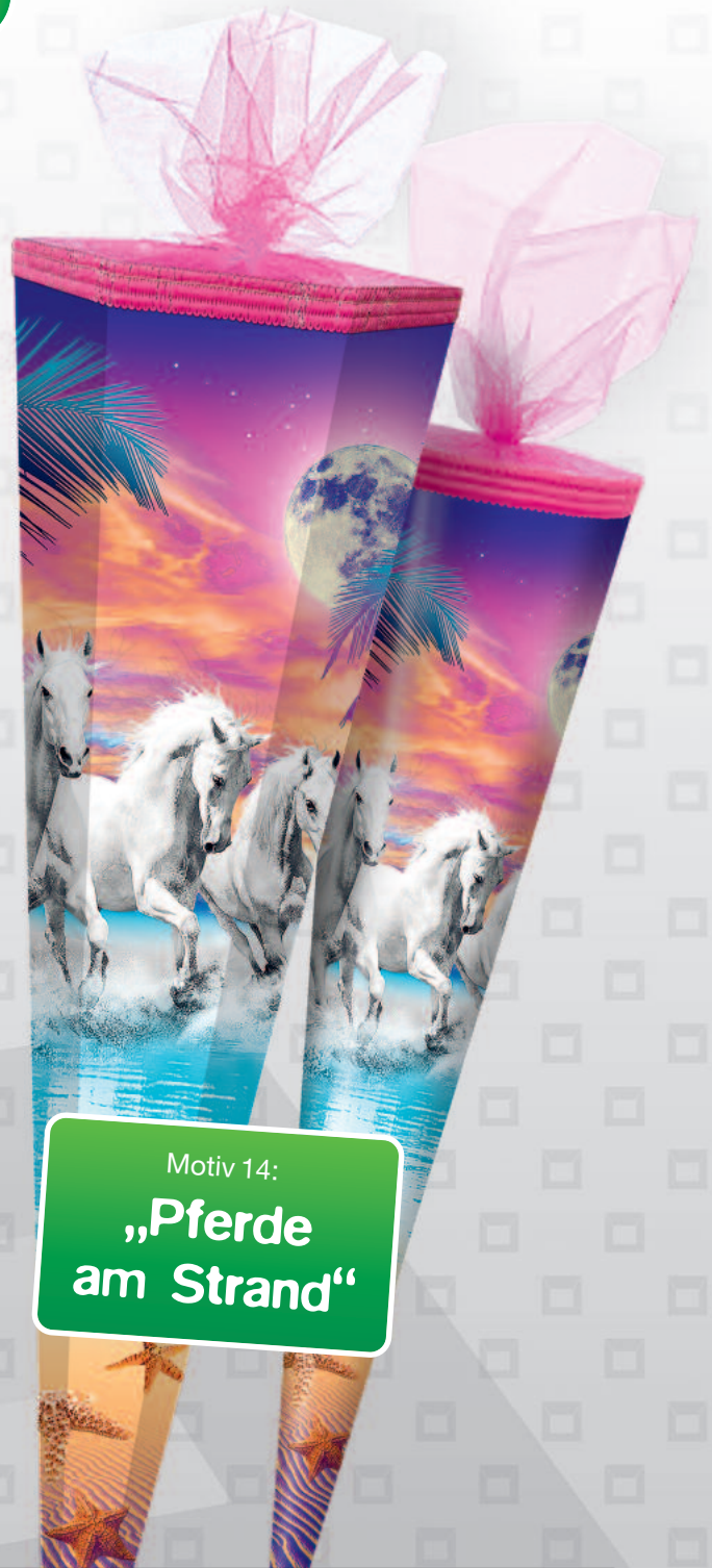
Motiv 14: „Pferde am Strand“