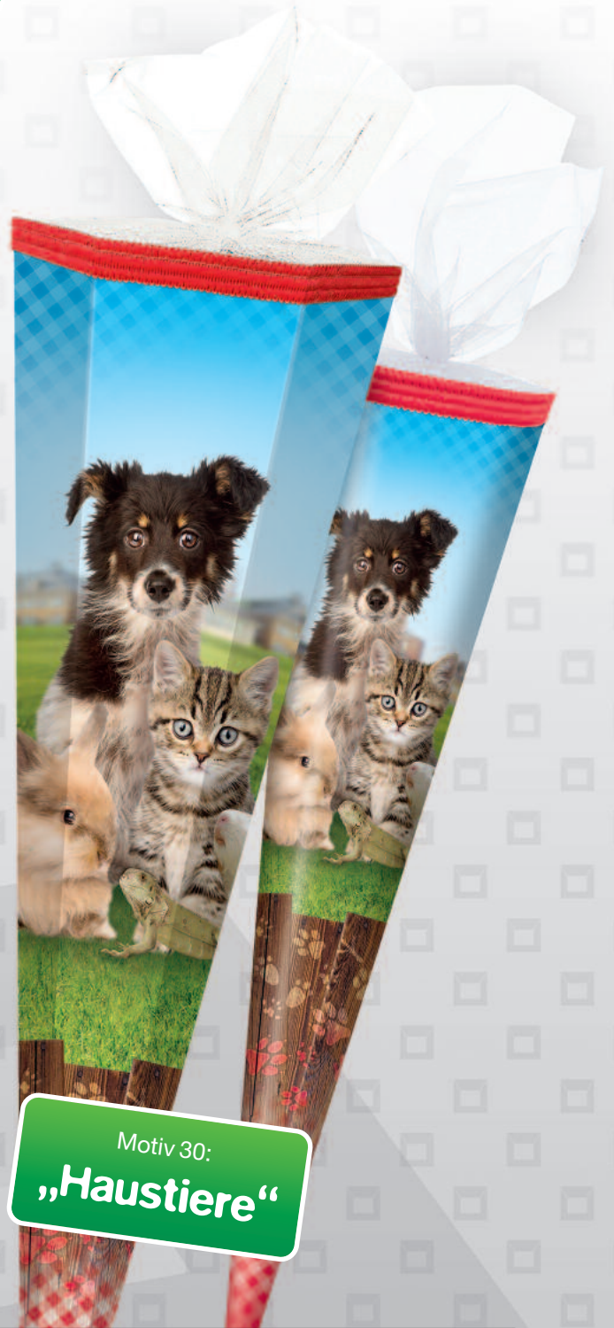
Motiv 30: „Haustiere“