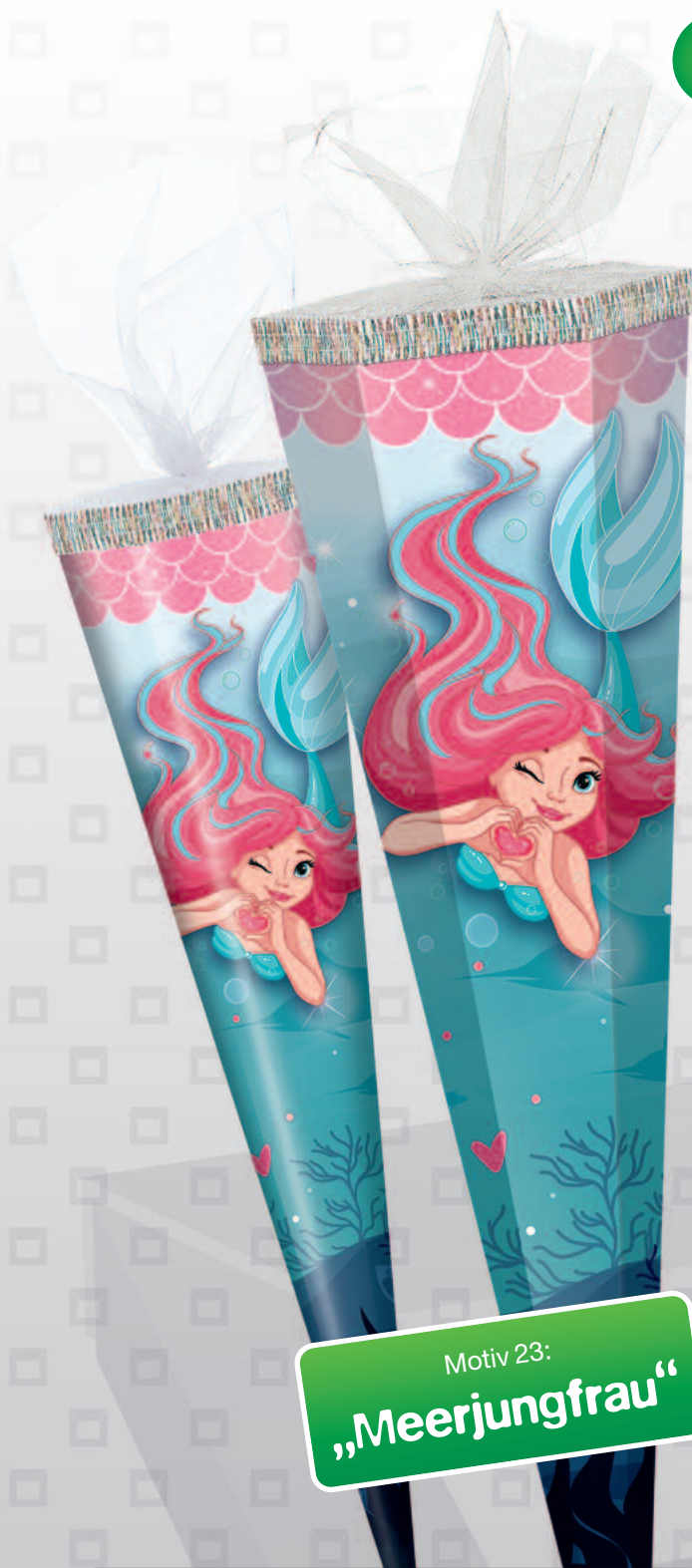
Motiv 23: „Meerjungfrau“