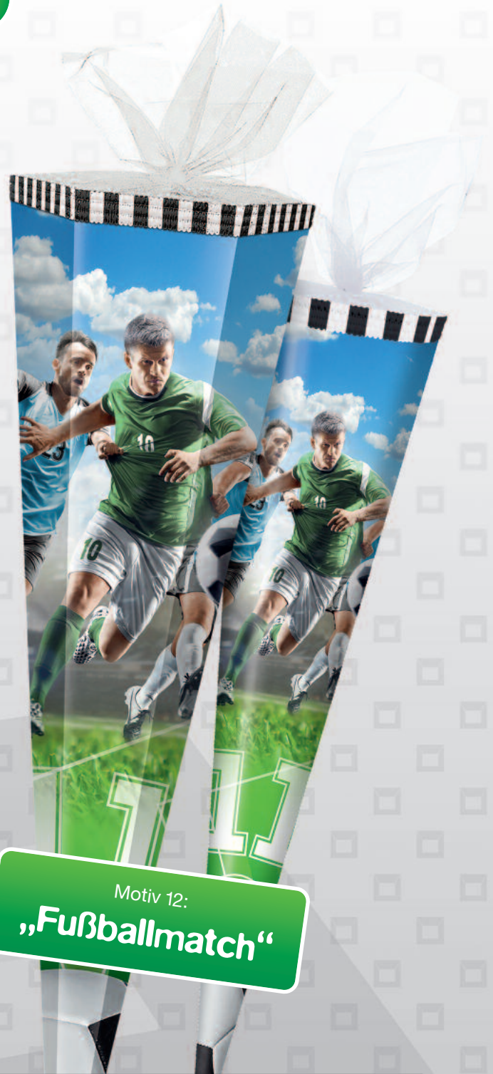
Motiv 12: „Fußballmatch“