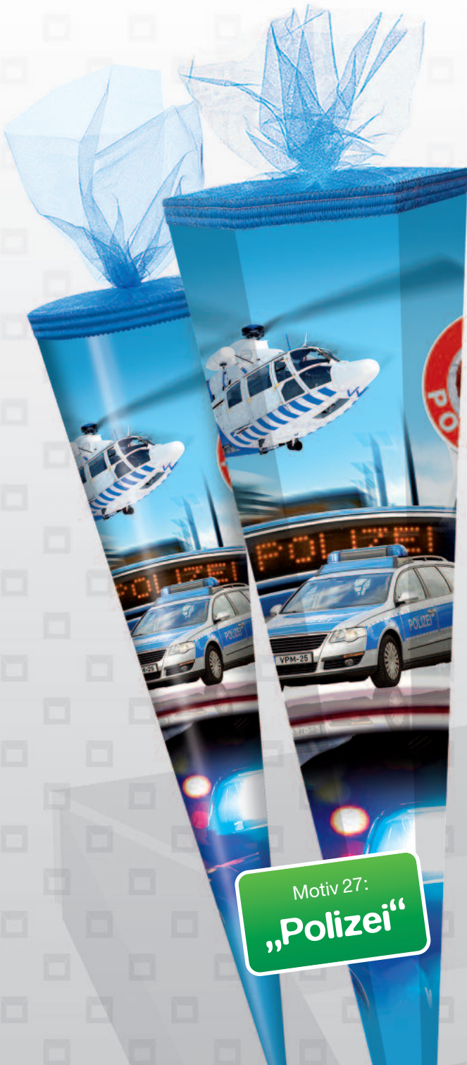
Motiv 27: „Polizei“