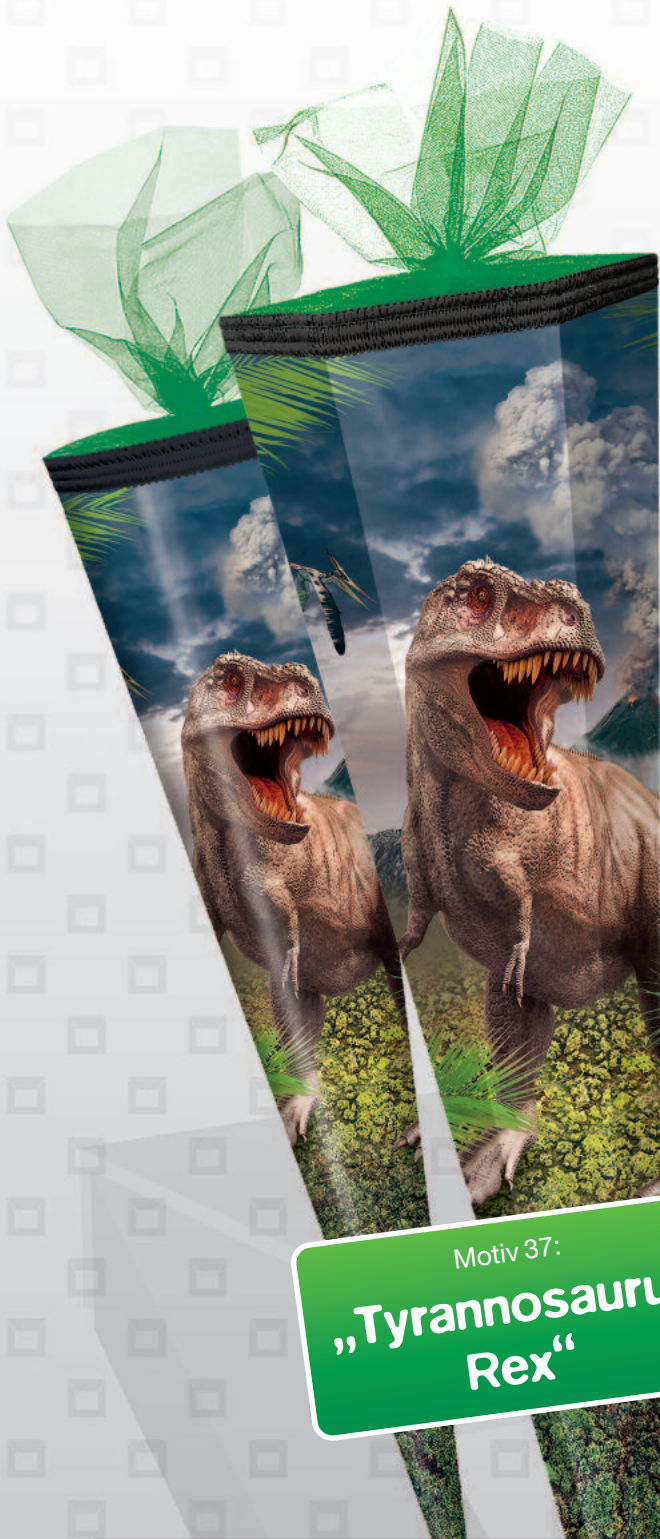
Motiv 37: „Tyrannosaurus Rex“