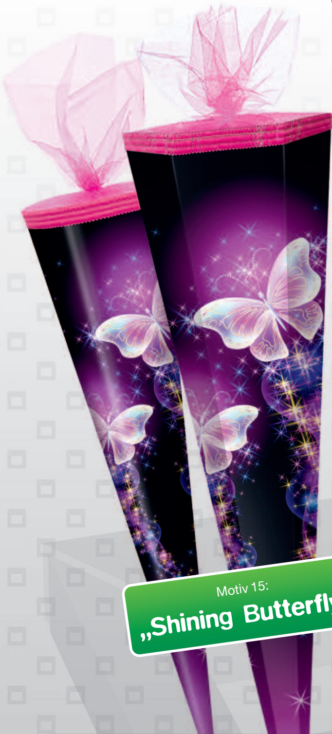
Motiv 15: „Shining Butterfly“