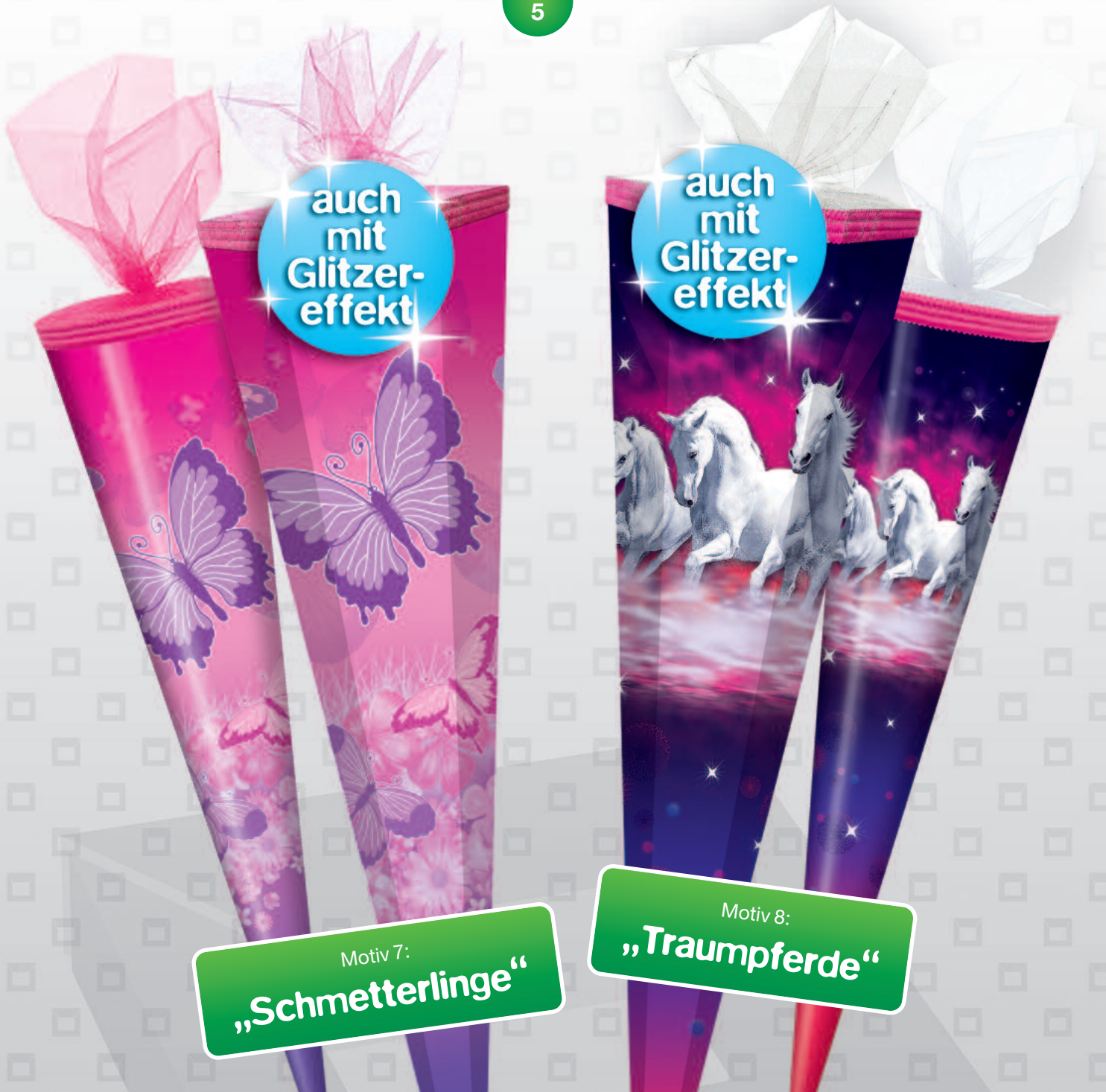
Motiv 7: „Schmetterlinge“