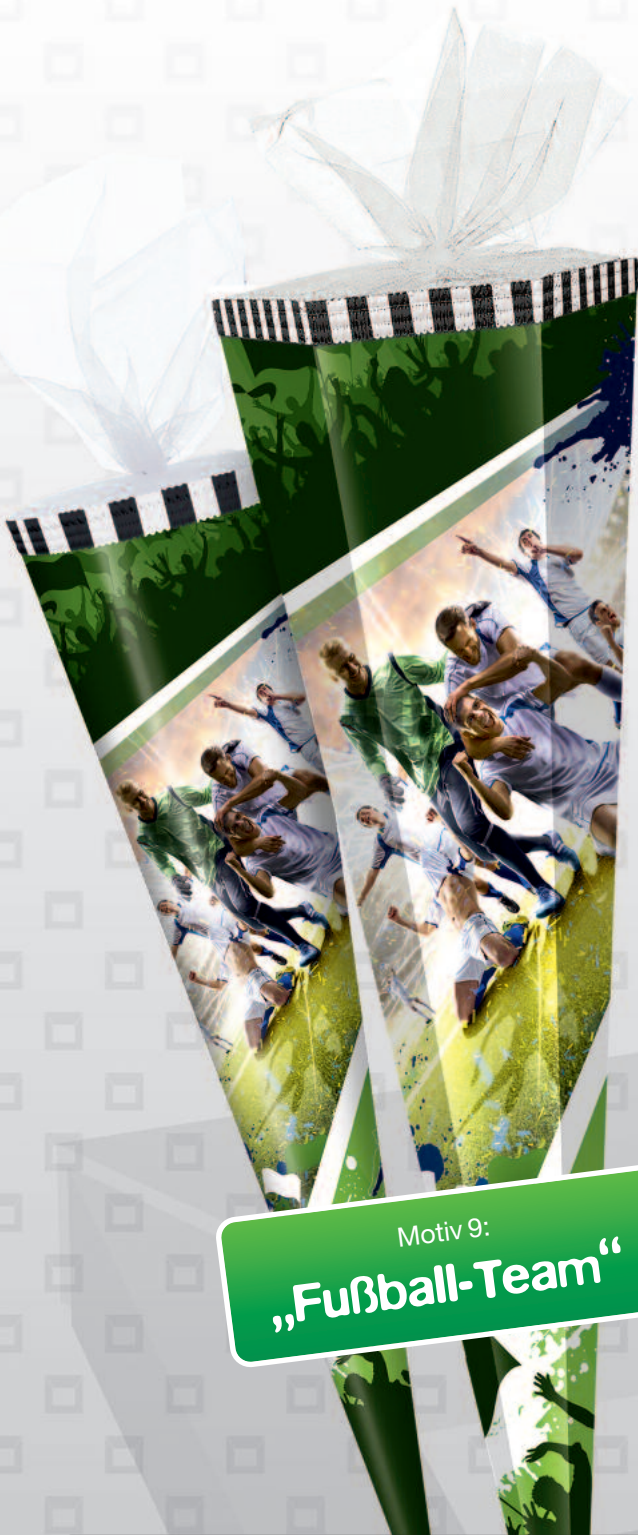
Motiv 9: „Fußball-Team“