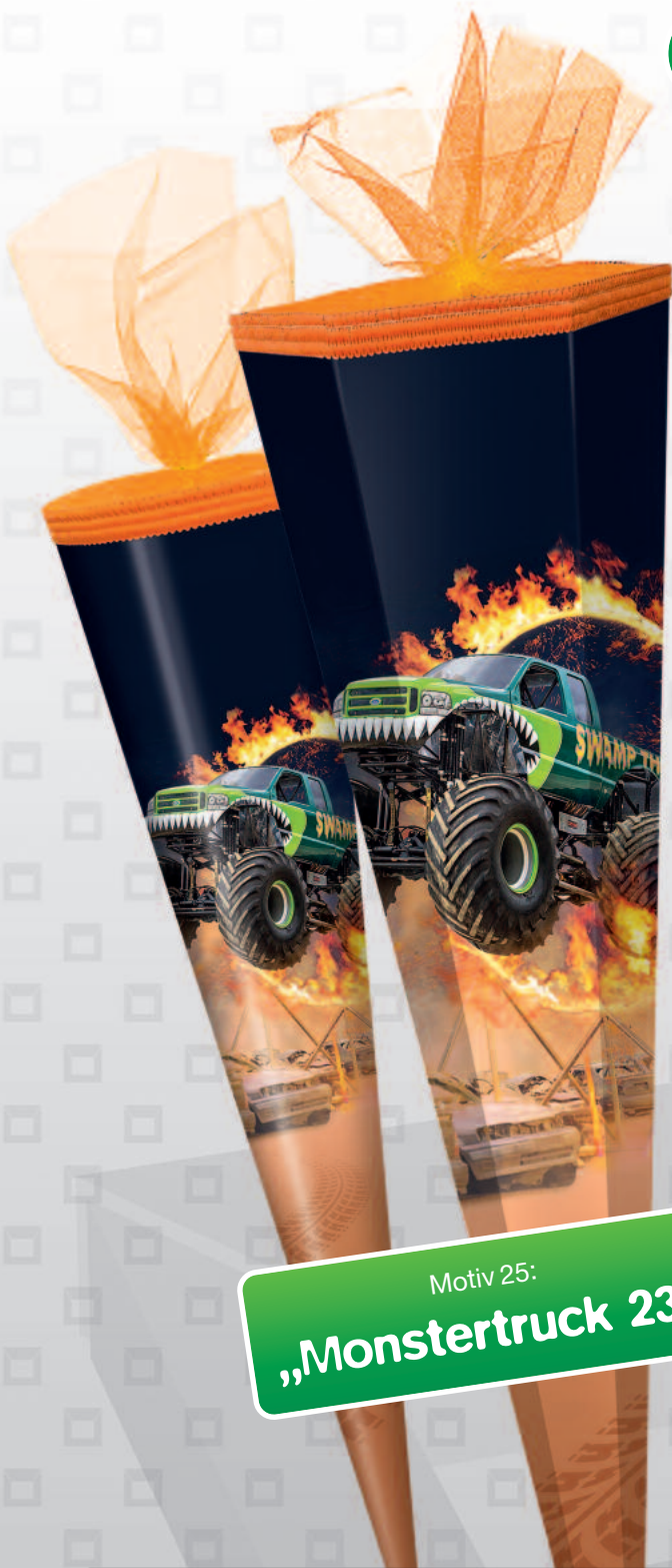
Motiv 25: „Monstertruck 23“