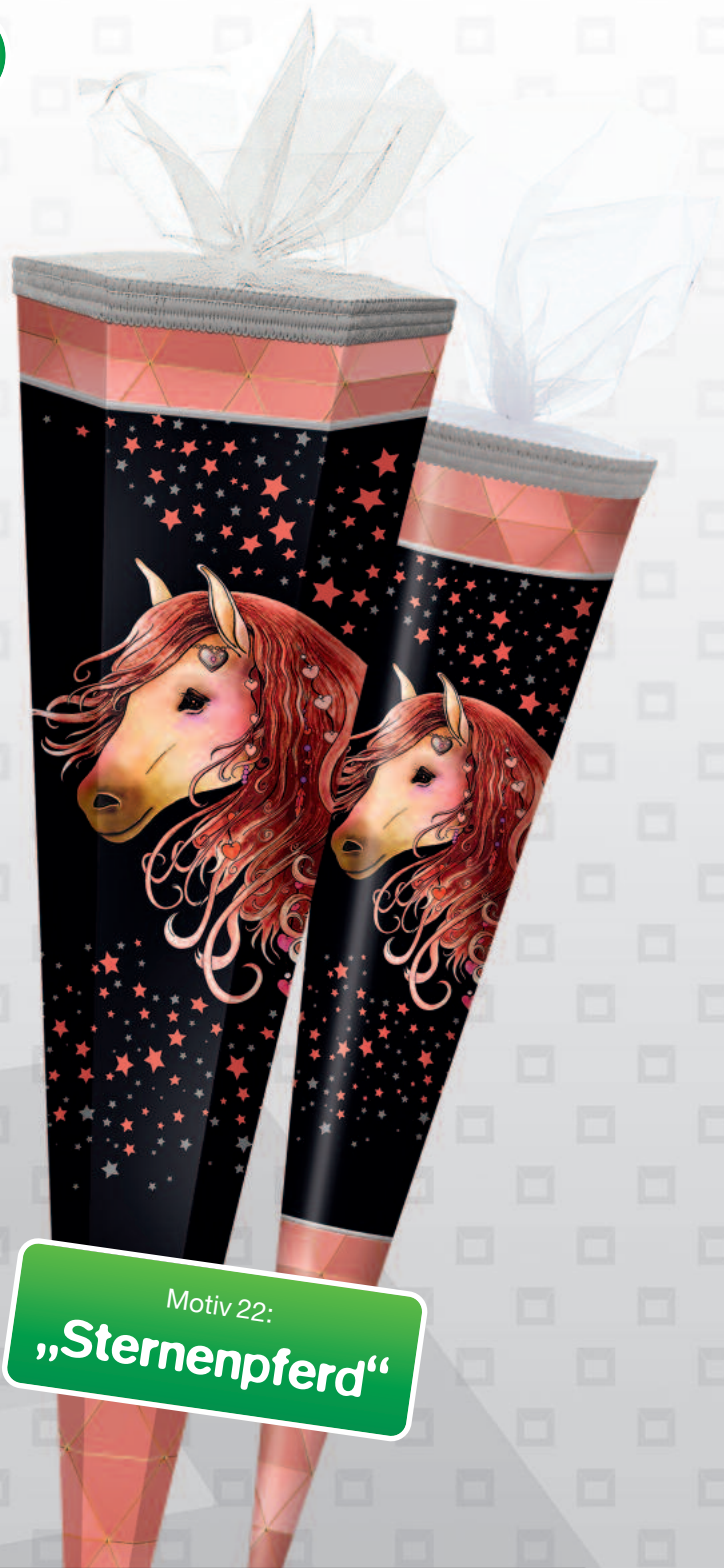
Motiv 22: „Sternenpferd“