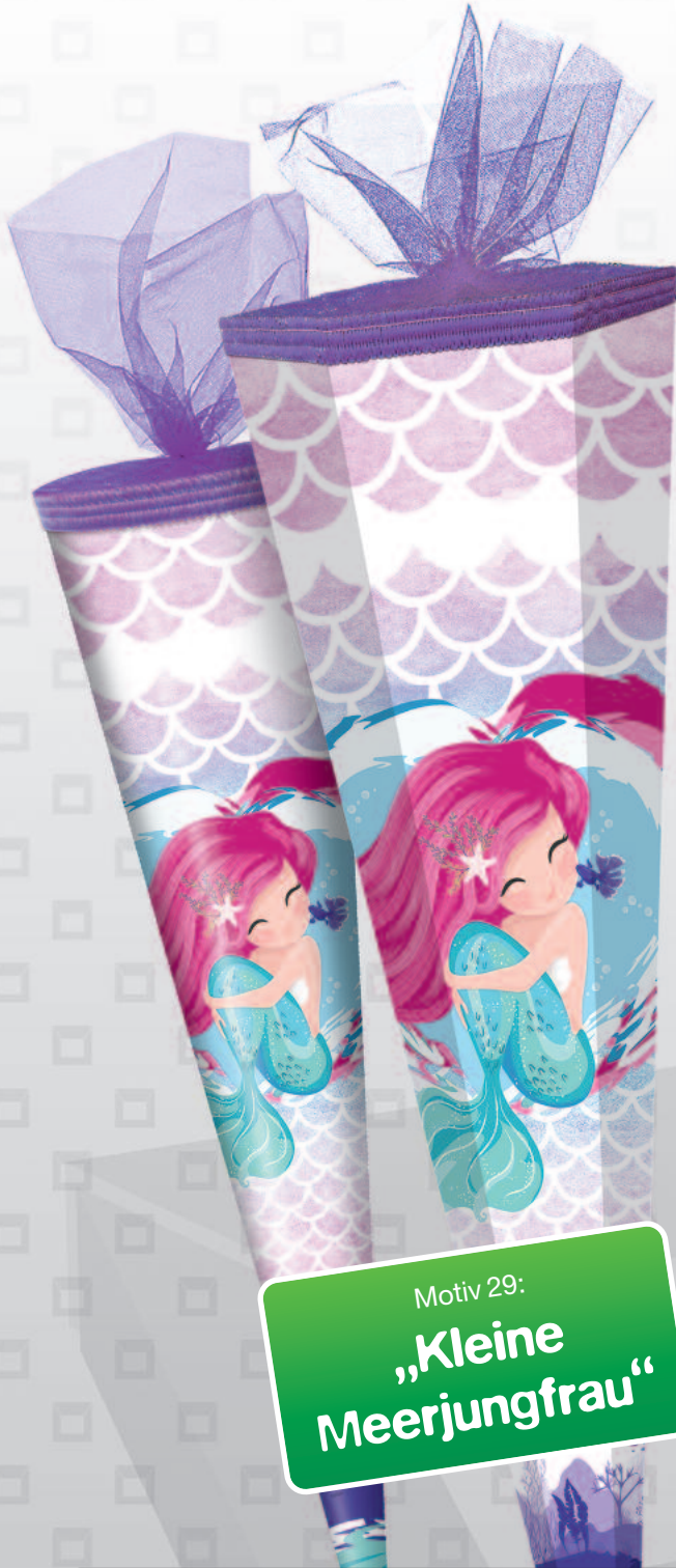
Motiv 29: „Kleine Meerjungfrau“