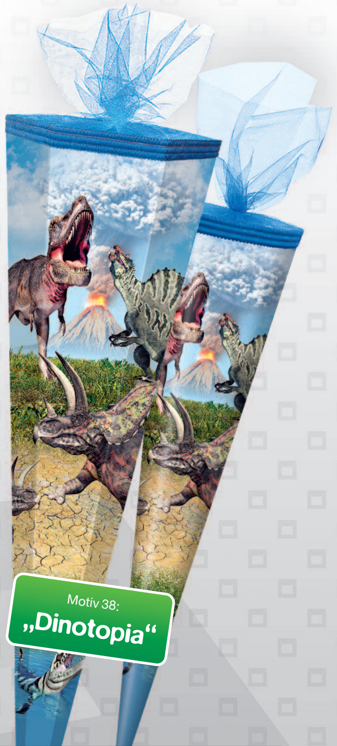
Motiv 38: „Dinotopia“