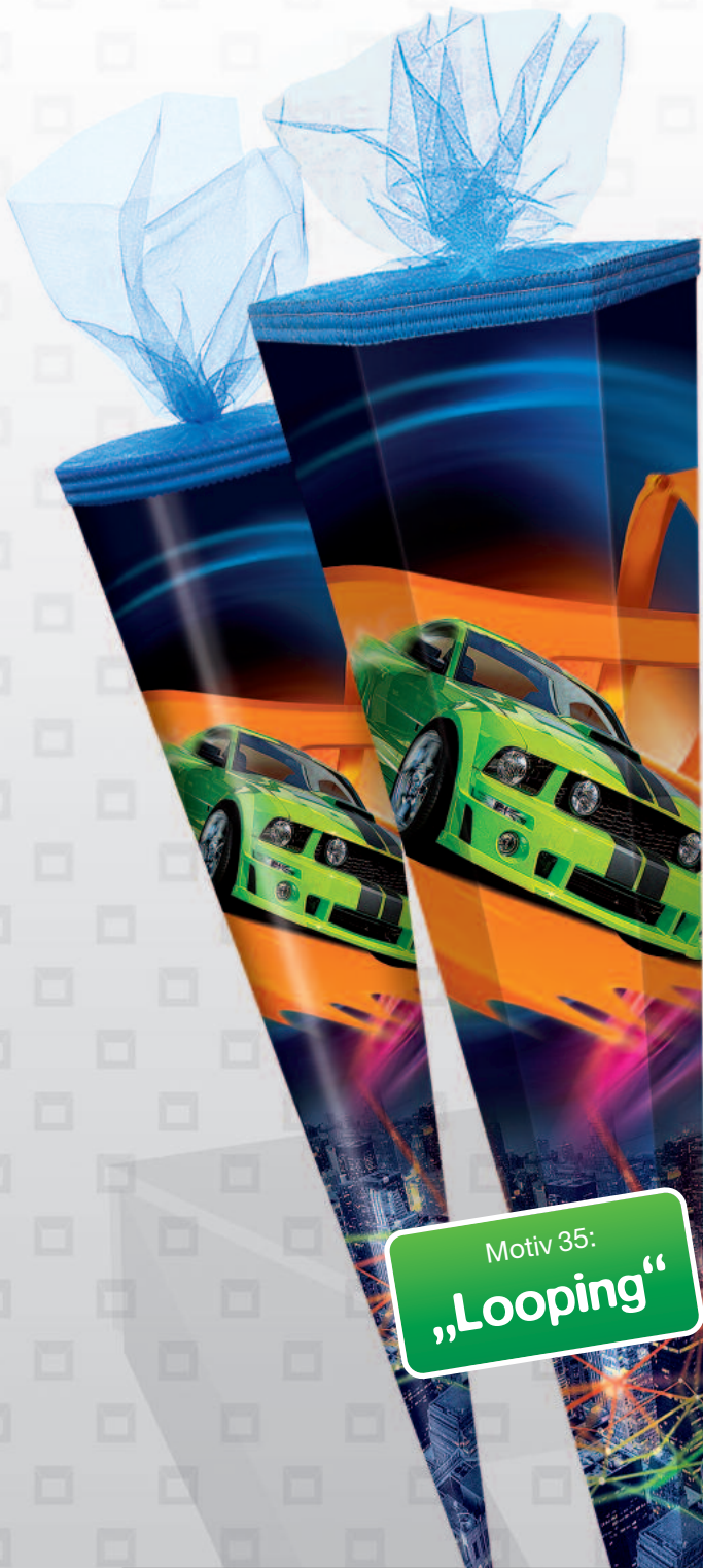
Motiv 35: „Looping“