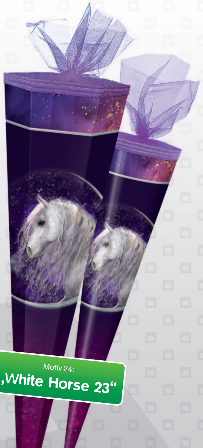
Motiv 24: „White Horse 23“