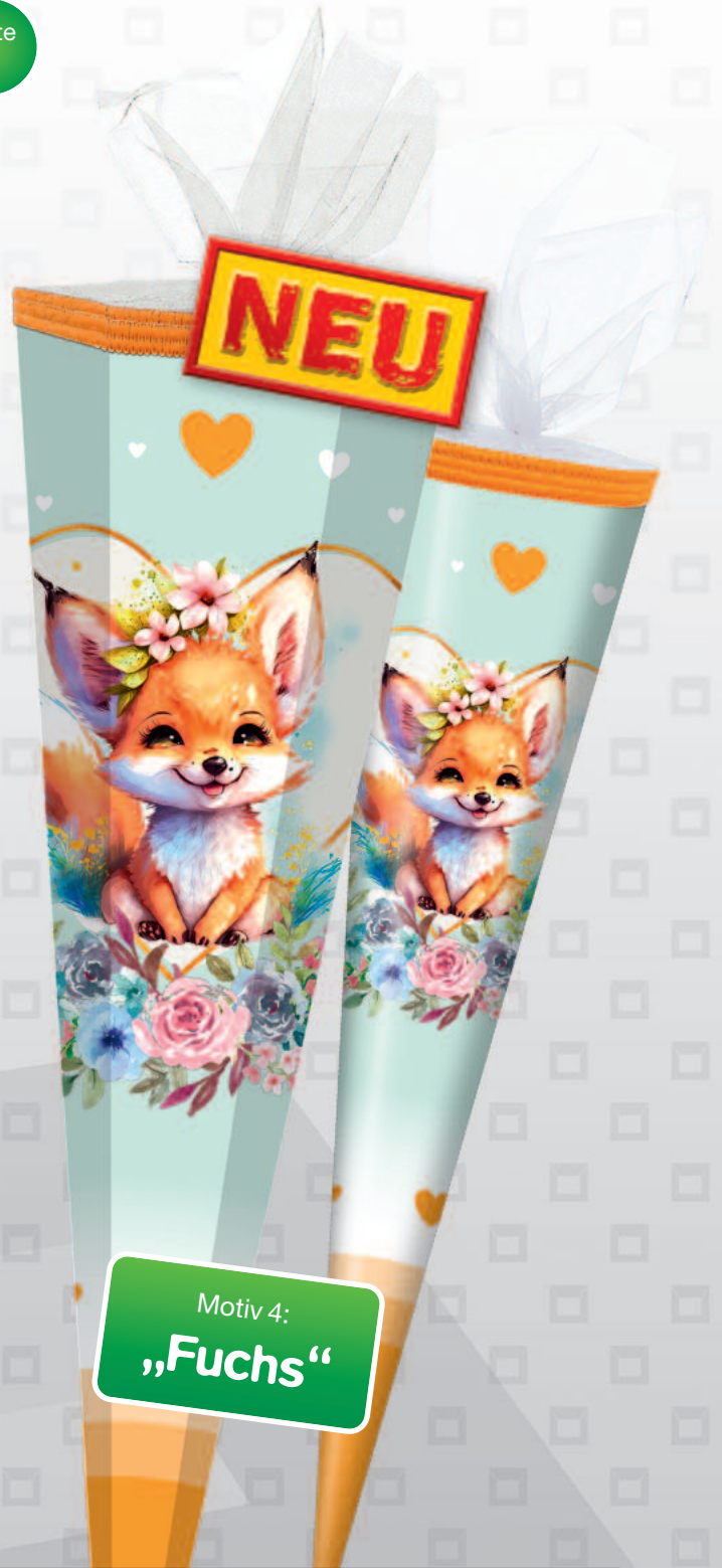
Motiv 4: „Fuchs“