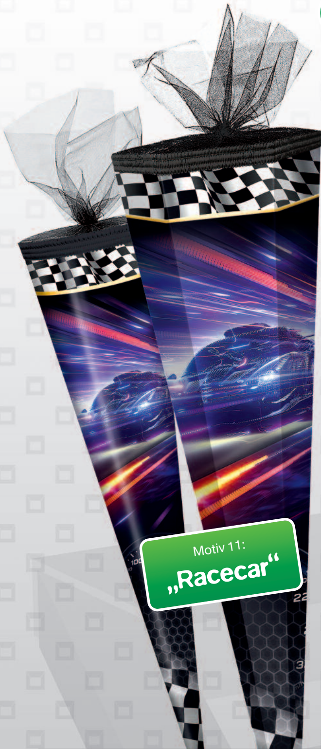
Motiv 11: „Racecar“