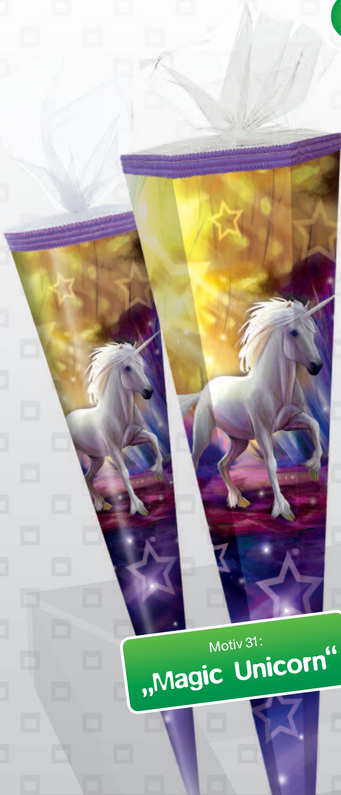
Motiv 31: „Magic Unicorn“