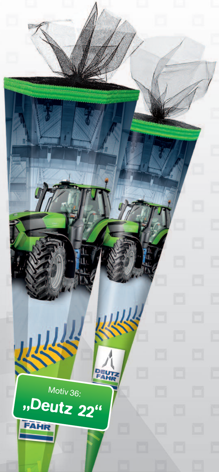
Motiv 36: „Deutz 22“