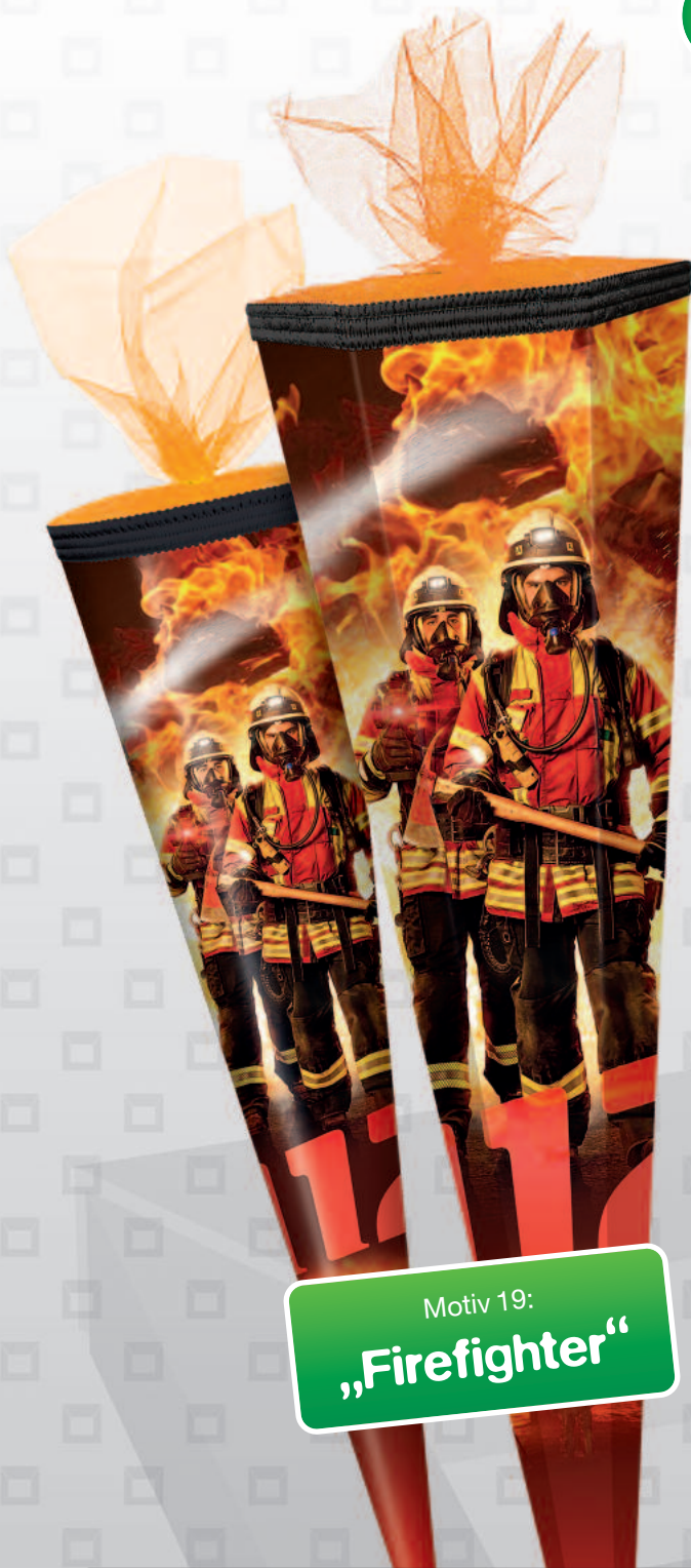
Motiv 19: „Firefighter“