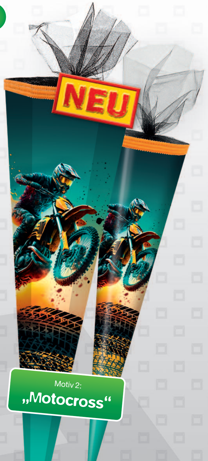
Motiv 2: „Motocross“