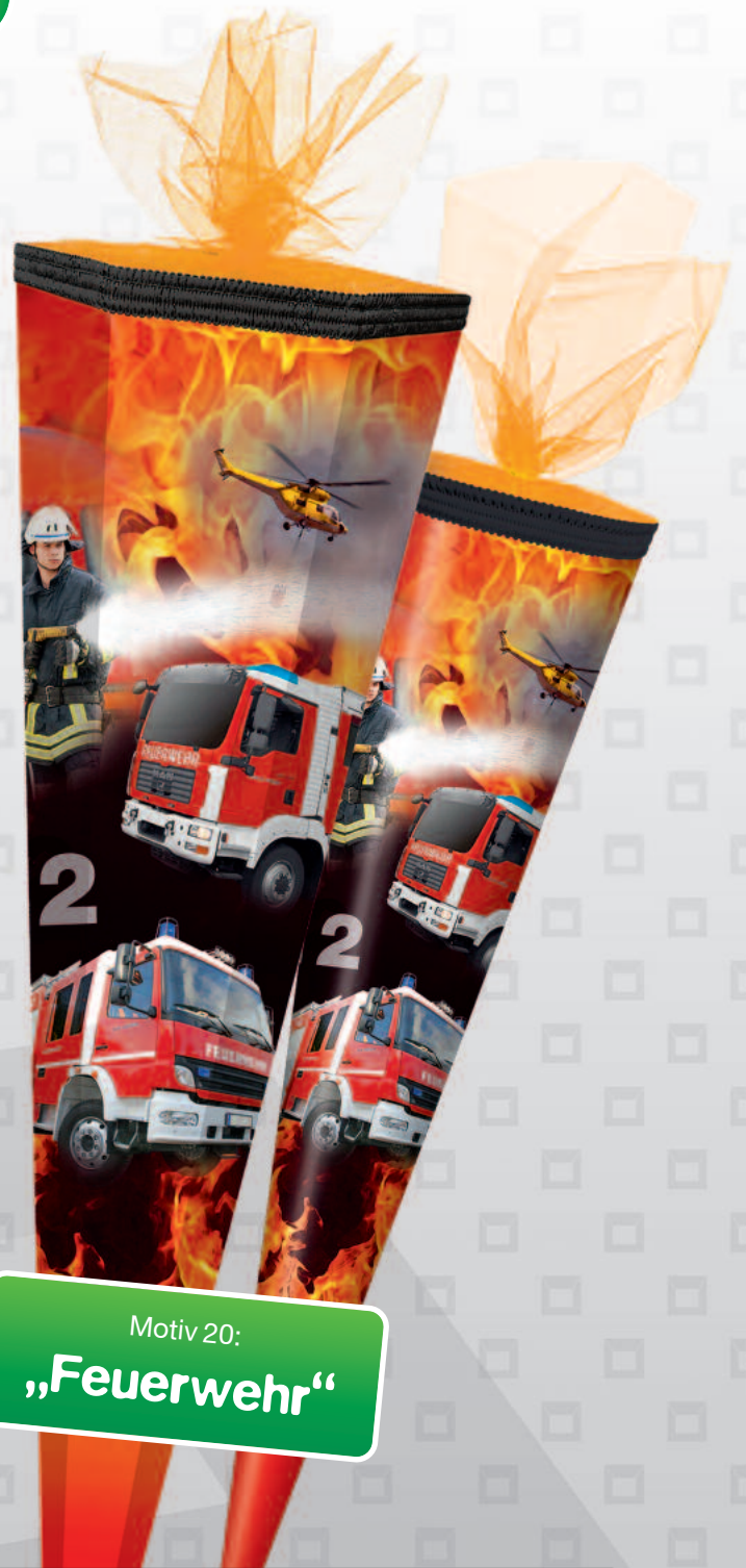
Motiv 20: „Feuerwehr“