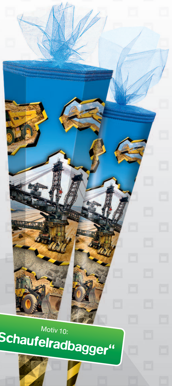
Motiv 10: „Schaufelradbagger“