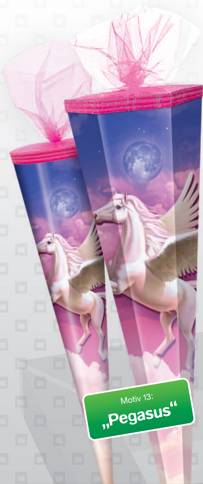
Motiv 13: „Pegasus“