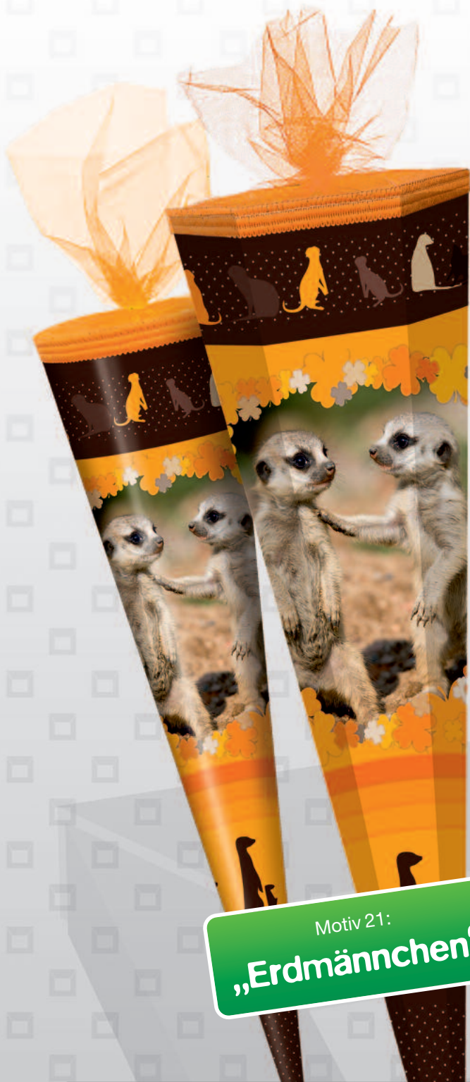
Motiv 21: „Erdmännchen“